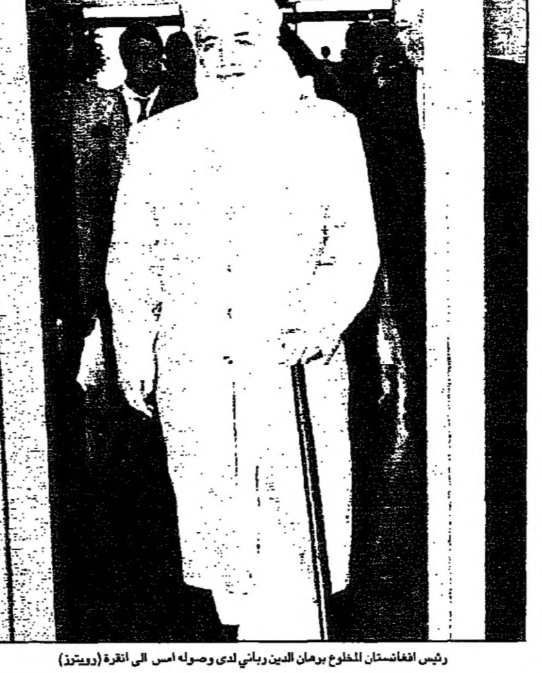
رئيس أفغانستان المخلوع برهان الدين رباني لدى وصوله الى أنقرة